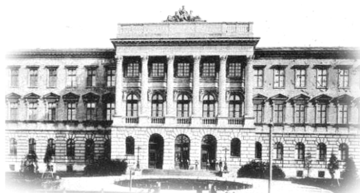
Головний корпус Львівської політехніки

Національний університет "Львівська політехніка" Колегія та профком студентів і аспірантів Рада молодих вчених